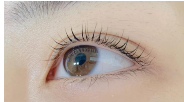
ラッシュリフトカール後