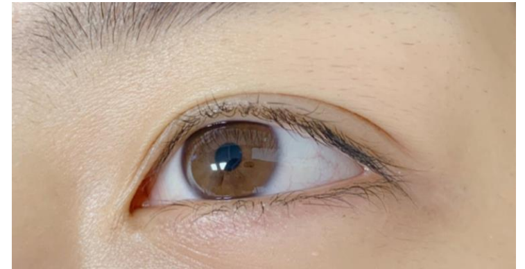
ラッシュリフトカール前