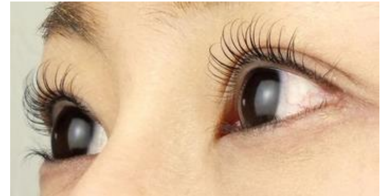
まつげカール くるんっとした仕上がり ¥4,100