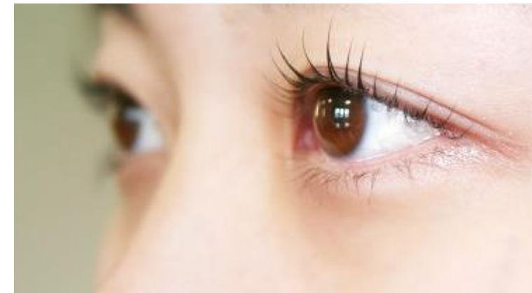
パリジェンヌ ストレートに根元からパッチリ ¥6,500