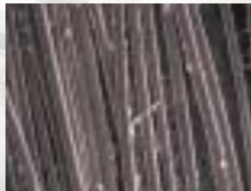
汚れが付着した髪