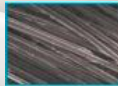
炭酸泉で流した場合 汚れや付着物をほとんど除去