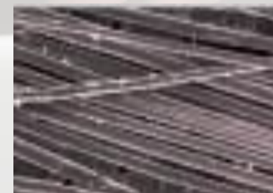
お湯で流した場合 汚れや付着物が十分に取れていない